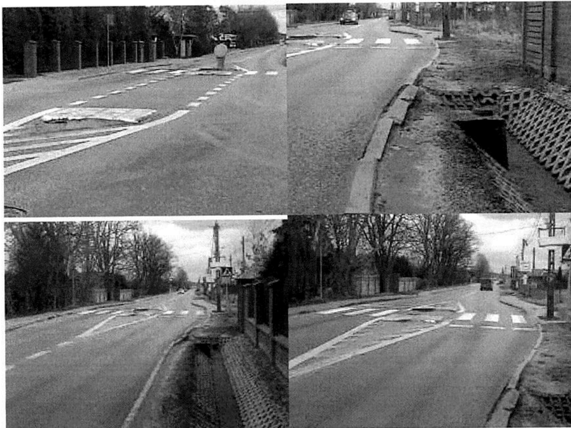
Zdewastowane wysepki ul. Rolna w Kajetanach